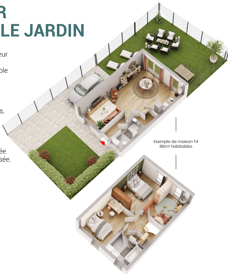
Exemple de maison T4 86m 2 habitables

La lumière baigne la pièce de vie dotée d'une porte-fenêtre en rez-de-chaussée.