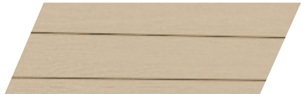
Bardage en composite aspect bois

La résidence s'insère naturellement dans la ville et vient magnifier le cœur du bourg avec une architecture moderne et un bel environnement végétal. La brique rouge, les tuiles brunes et grises s'insèrent dans l'habitat existant tandis que les enduits beiges/terre et les toitures plates en alternance apportent une touche de modernité. Un bardage effet bois contribue à l'esprit authentique et nature de la résidence.