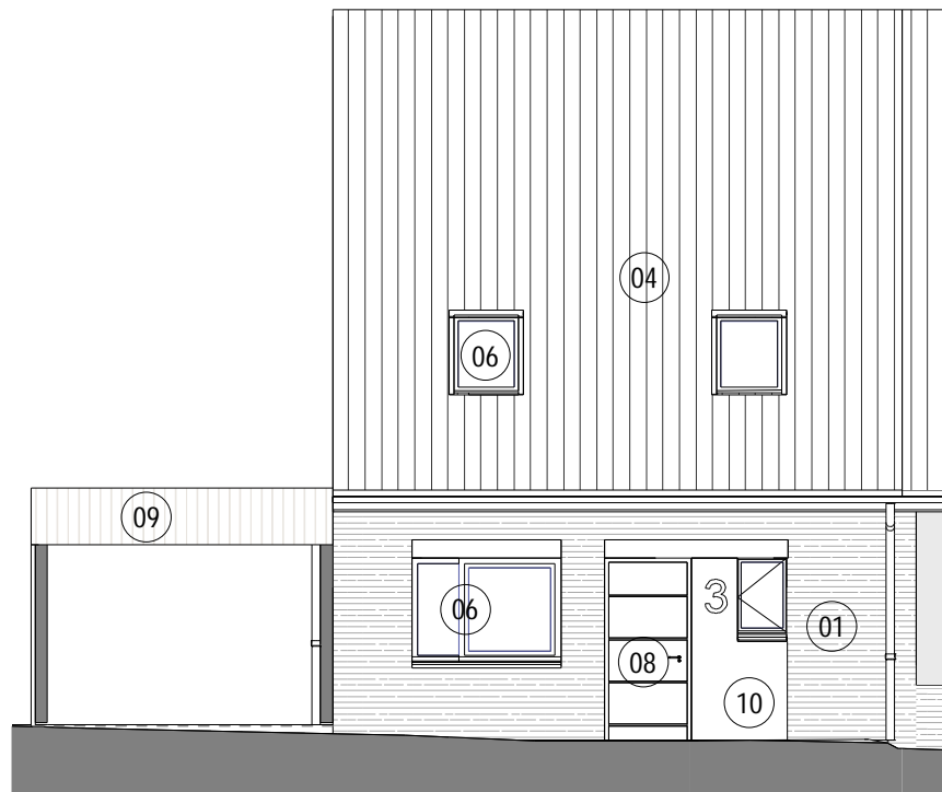
1 ML10 Maison 16 ELEVATION SUD