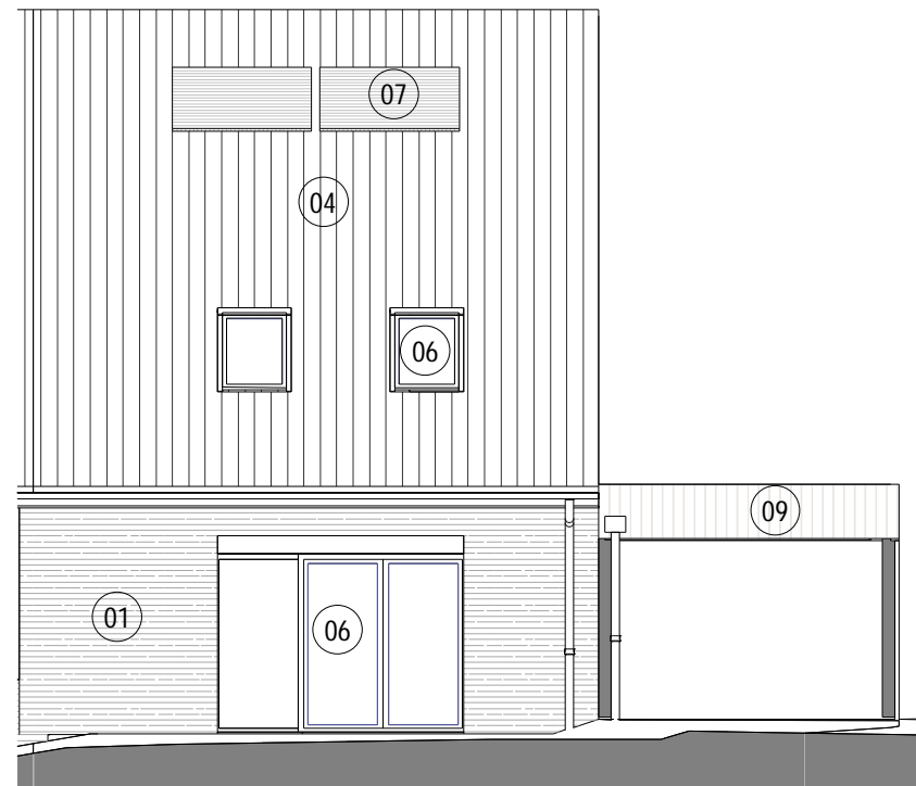
2 ML10 Maison 16 ELEVATION NORD