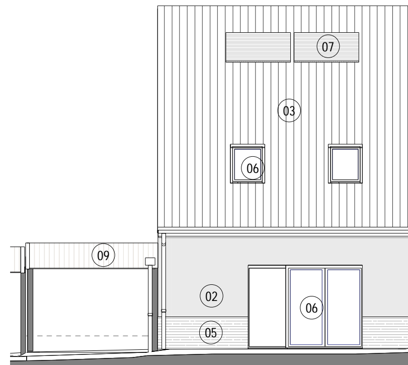
2 ML10 Maison 17 ELEVATION NORD