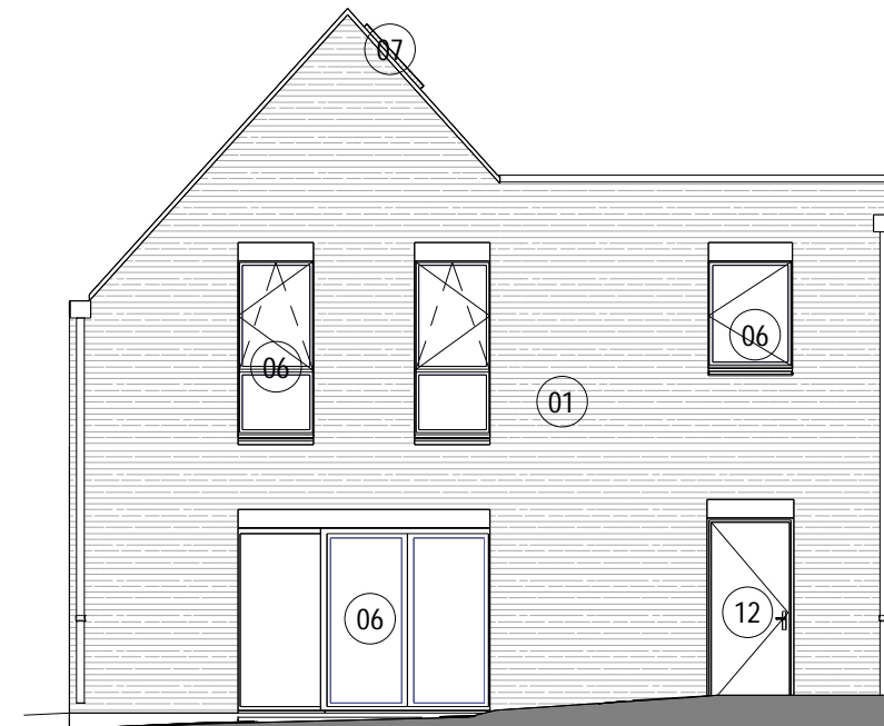
2 ML3A Maison 02 ELEVATION NORD OUEST