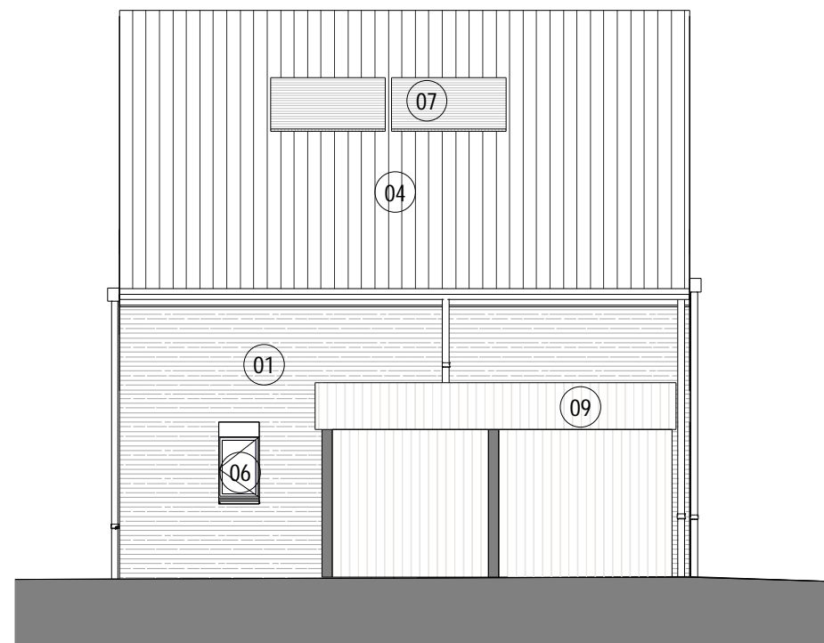
3 ML4 Maison 03 ELEVATION SUD OUEST