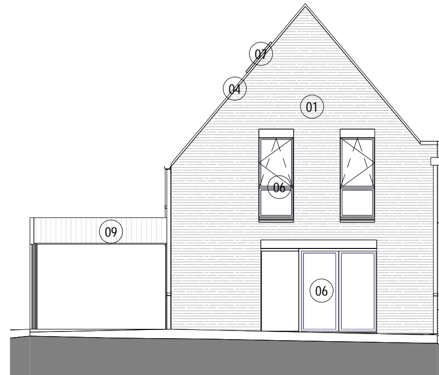
2 ML4 Maison 03 ELEVATION SUD EST